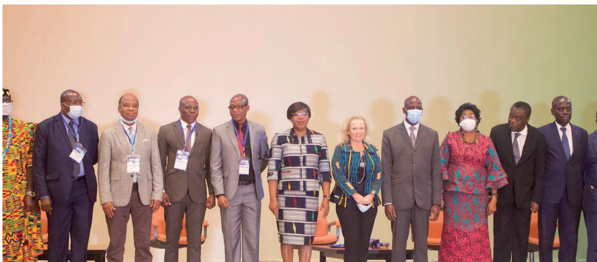
JOURNÉE INTERNATIONALE DE LA PAIX • 21 09 2020