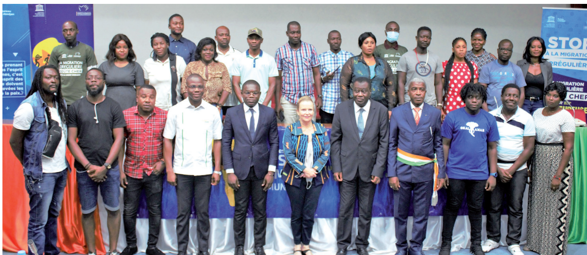
FORUM UNESCO D'ECHANGES SUR LA MIGRATION IRREGULIERE • 05 12 2021