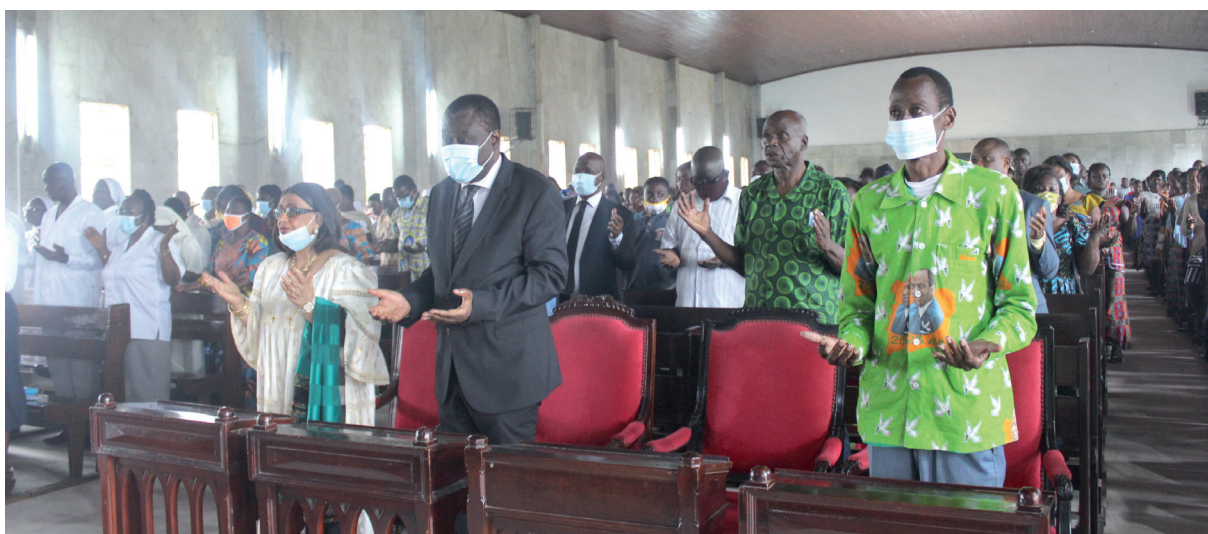
COMMEMORATION DU JOUR DE NAISSANCE DU PRESIDENT FELIX HOUPHOUËT-BOIGNY