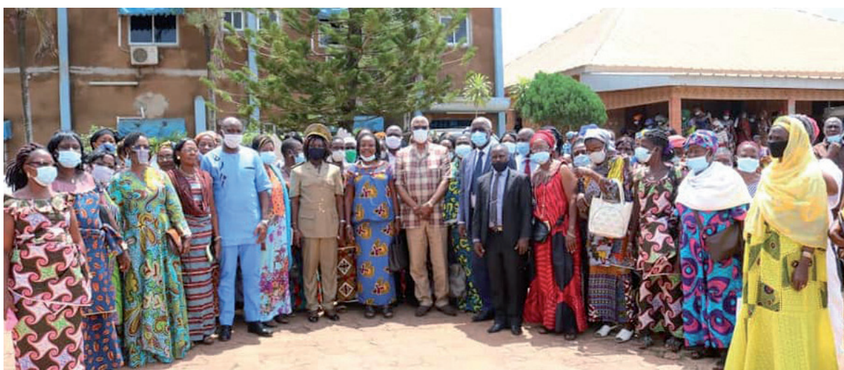
ATELIER DE FORMATION DE 200 FEMMES LEADERS DU DÉPARTEMENT DE GAGNOA • 22 07 2020