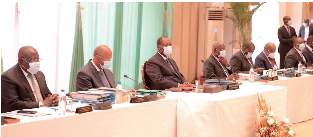
CONSEIL DES MINISTRES • 30 09 2020